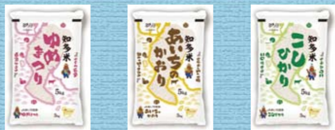
知多米「ゆめまつり」 知多米「あいちのかおり」 知多米「こしひかり」

「知多半島の米を知多半島で食べていただきたい」という思いが込められた「知多米」を、ぜひ食卓でお楽しみください。