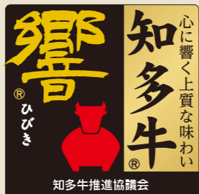
このマークが「知多牛」の目印

半島内で1年以上肥育された2等級以上の肉質のものを知多牛「響」とし、それぞれの銘柄で販売していきます。ブランドを統一することで年間の出荷頭数は県内一の6000頭となり、交雑種としては全国有数の産地となります。今後さらなるブランド名の浸透と販売強化をめざします。