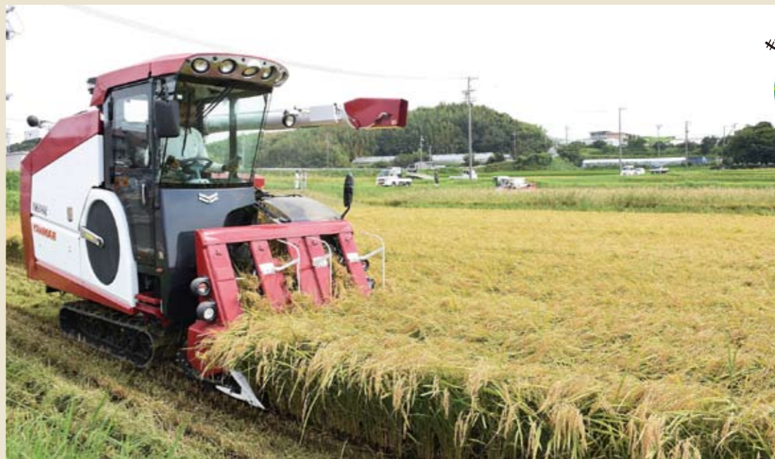
大型コンバインで刈り取られる知多米

3種類のアイテムを取りそろえました。 ※JAのグリーンセンター・グリーンプラザ で買い求めください。