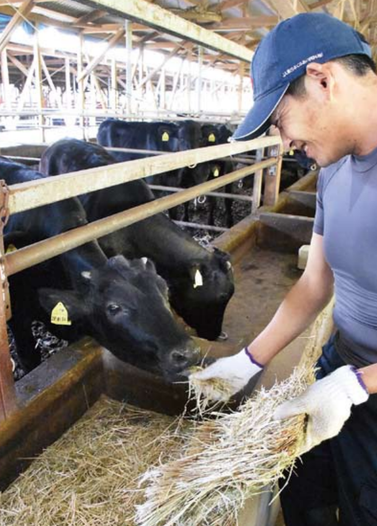
丁寧に肥育される知多牛